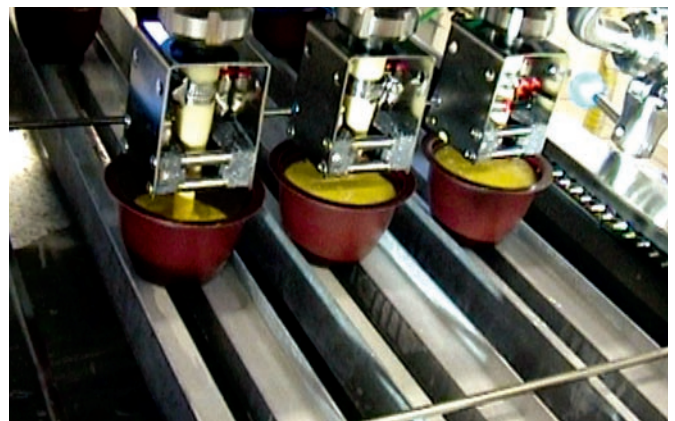
Afvullen van dessert met Fillflex Compact Sequence.

De Fillflex Compact Sequence uitgerust met slangafsluiters voor het opeenvolgend vullen van drie recipiënten.